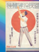
国民保健体操の ポスター(昭和4年)