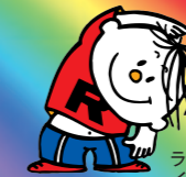
ラジオ体操 イメージキャラクター ラジオ体操坊や (通称:ラタ坊)

ラジオ体操のイメージキャラクター ラジオ体操坊やの誕生。 特別巡回ラジオ体操会の開始。